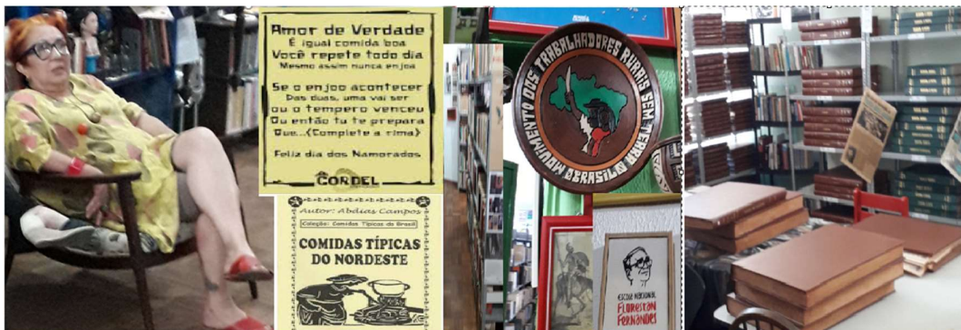
Figura 4 - Adelaide Gonçalves no seu espaço, e aspetos icónicos das salas do PLEBEU, terminando na sala que contém um arquivo dos jornais de Fortaleza

Entrando então pela porta do elevador da Figura 3, deparamo-nos com a ANTECÂMARA (01), que é a ‘sala de estar’ de Adelaide. Percorrendo clockwise as salas 1, 2, 3, tirámos fotos como as da Figura 4, onde surgem alguns ‘cordéis’ em que o ‘amor’ se associa à comida (com receitas de pratos nordestinos) e outros objetos relativos às memórias de Adelaide.