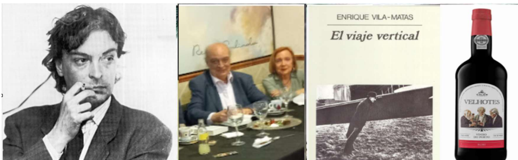
Figura 2- Vila-Matas com a sua musa e com o seu Vinho do Porto

Este catalão inventado, quando tendia para a idade mayor , percorria em ‘estado de graça’ as cidades onde trabalhara anteriormente, armado só de um caderninho onde legendava tudo o que lhe despertava o interesse, por exemplo, o rótulo do Vinho do Porto da marca VELHOTES, cuja degustação lenta lhe dava um extraordinário prazer (Figura 2).